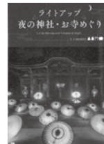
ライトアップ 夜の神社・お寺めぐり