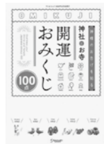
神社とお寺 開運おみくじ