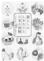
暮らしのしきたりと日本の神様