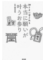
神さまに愛される 本当に願いが叶うお参り