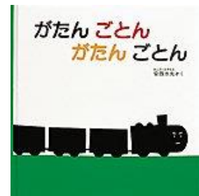
がたん ごとな がたん ごとな 安西 水丸/作 福音館書店