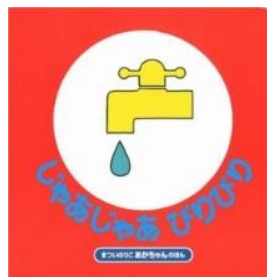
じゃあじゃあ びりびり まつい のりこ/作・絵 偕成社