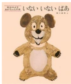
いない いない ばあ 松谷 みよこ/文 瀬川 康男/絵 童心社