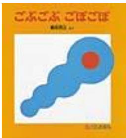
ごぶごぶ ごぼごぼ 駒形 克己/作 福音館書店