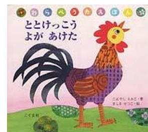
ととけっこう よがあげた こばやし えみこ/案 ましま せつこ/絵 こぐま社