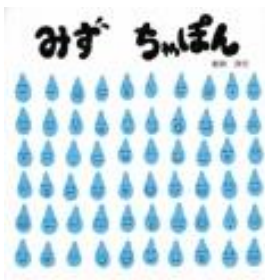
みずちまぼん 新井 洋行/作 童心社